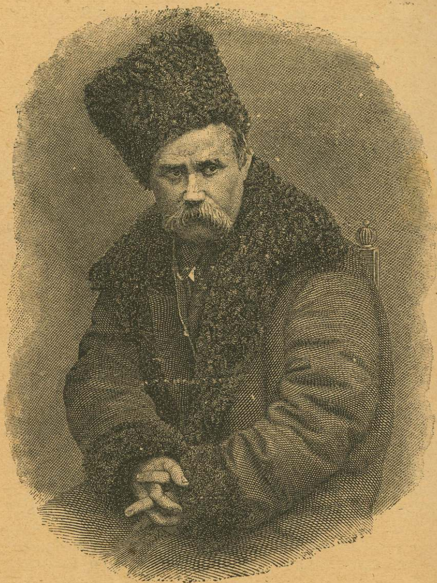
Т а р а с Ш е в ч е н к о .