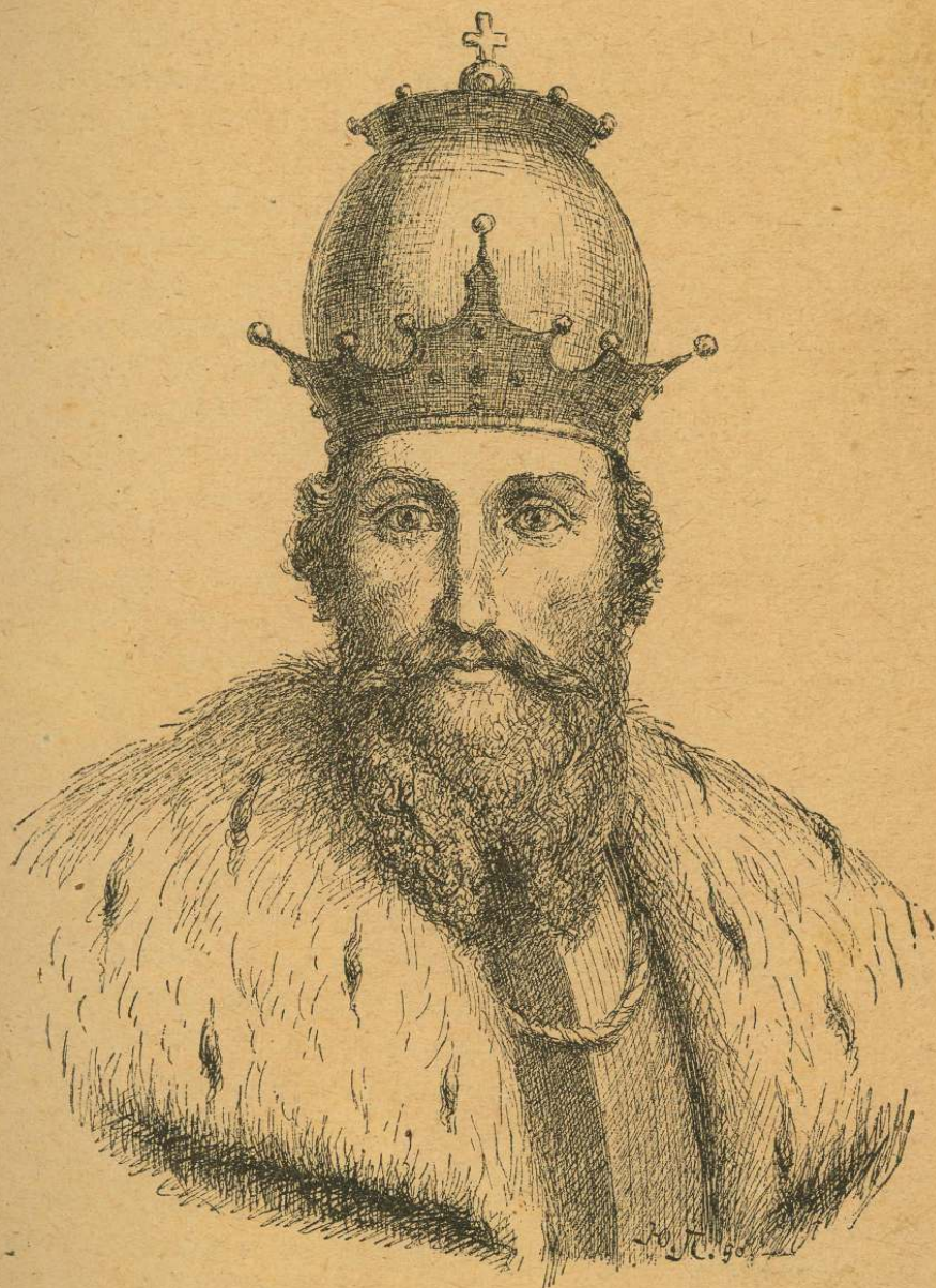
Князь Данило, король Руси.