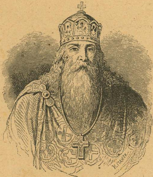
Князь св. Володимир Великий.

по Різдві Христа) і тут оснував сильну державу Русь, котрої осередком став Київ. Се місто вибрав собі столицею князь Олег. Русини були спершу поганями, почитали всяких богів, а найбільш Перуна. Але вже княгиня Ольга стала християнкою і з того часу починає з Царгороду християнська віра помалу ширити ся на