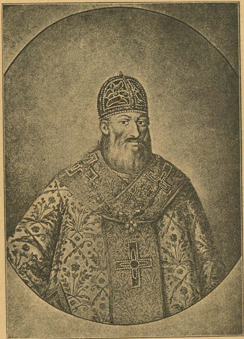
Київський митрополит Петро Могила.