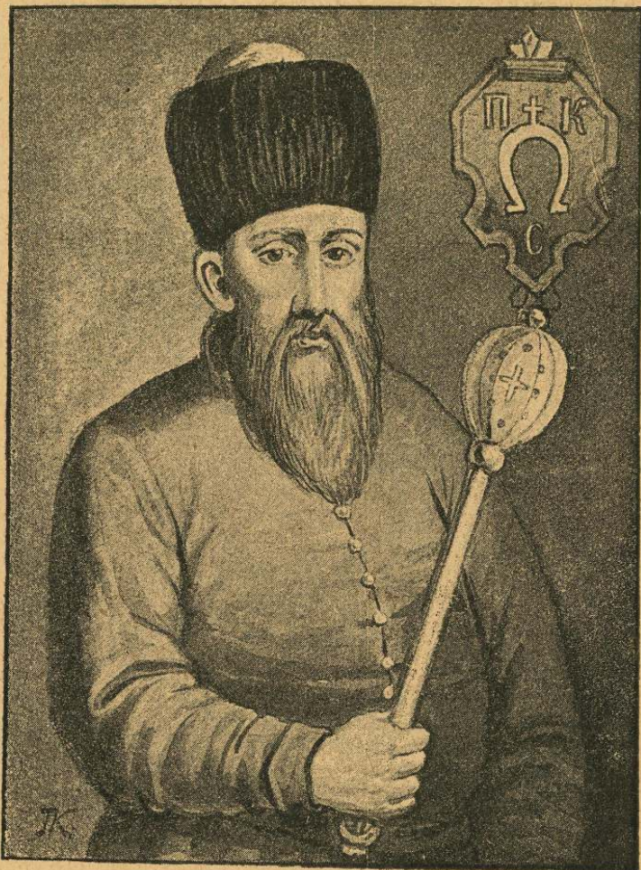
Петро Конашевич Сагайдачний.

помер (1622 р.). Перед смертю записав він значну часть свого майна на різні школи а особливо на київську